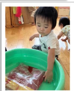
そっと触っていますね