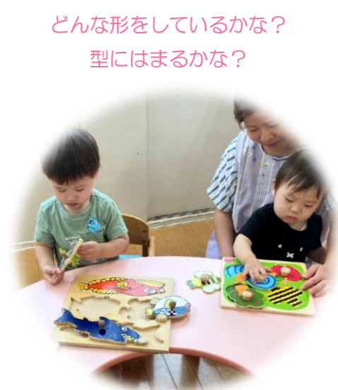
どんな形をしているかな？ 型にはまるかな？