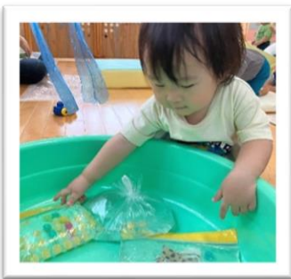
触り心地を確かめています👁️