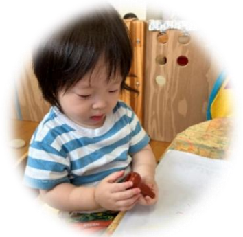
クレヨンの 持ち方を考えていますね