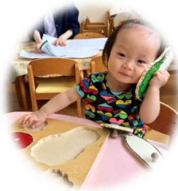
お野菜でもしもしも

お絵描きでは、クレヨンをしっかりと握って紙いっぱいにくるぐると絵を書く子もいれば、その様子をクレヨンを持ちながら見て、雰囲気を楽しんでいる子など遊び方は様々でした♪