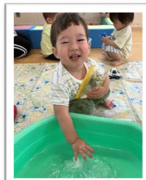
ぱんぱんってなや